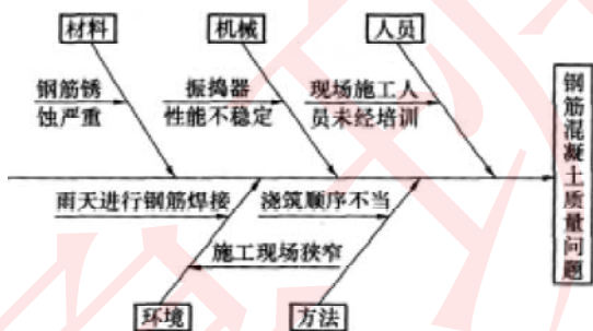
图 16-3 因果分析图

工程质量发生后，项目监理机构处理程序：①总监理工程师签发《工程暂停令》；②责成施工单位进行质量问题调查；③审核、分析质量问题调查报告，判断和确认质量问题产生的原因；④审核签认质量问题技术处理方案；⑤指令